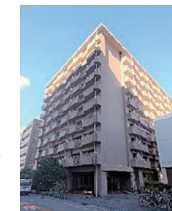
▲研修医宿舎(看護師宿舎A棟)

希望者は入居可能です。最寄駅まで徒歩5分、コンビニは敷地内にあり、ショッピングセンターも徒歩5分圏内にあるため、快適に過ごせる場所に立地しています。