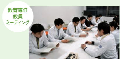
教育専任教員ミーティング

毎月2回教育専任教員が集まってミーティングを開催し、研修医対象セミナーの企画や各診療科の研修医教育について幅広く検討・意見交換を行っています。